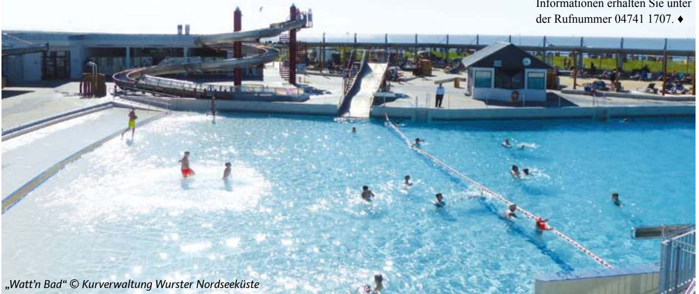
„Watt'n Bad“

Am Samstag, den 28. Mai 2016 um 14:00 Uhr ist im Freibad des schönen Ortsteils Midlum offizielles Anschwimmen. Das bei Gästen und Einheimischen gleichermaßen beliebte Schwimmbad startet also nunmehr auch in die Saison und lädt alle Interessierten zum Sprung in das kühle Nass ein. Das Bad wird direkt aus einer Quelle gespeist und verspricht eine angenehme Abkühlung an warmen Tagen. Zwei Rutschen und ein angrenzender Spielplatz machen den freien Tag zu einem Erlebnis. Mehr Informationen erhalten Sie unter der Rufnummer 04741 1707. ♦