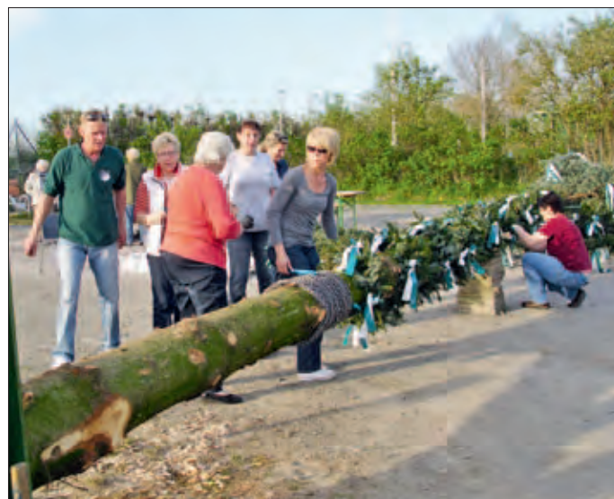
Der Baum wird geschmückt

Mit vereinten Kräften der „Alten Herren“ und den Ü45er