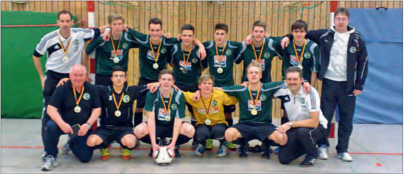
Erstmals ist es mit dem FC Land Wursten einer Mannschaft im Bezirk Lüneburg gelungen die Hallenbezirksmeisterschaft ungeschlagen zu gewinnen.