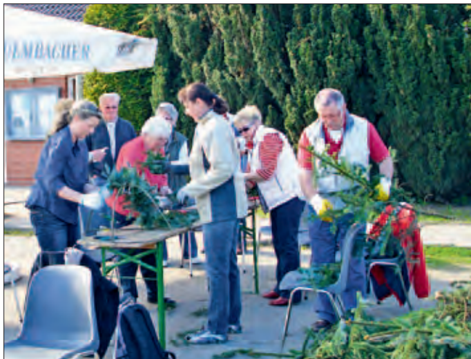
Die Kranzbinder bei der Arbeit

Das Organisationsteam hatte alles im Griff und sorgte für eine perfekte Verpflegung aller Gäste.