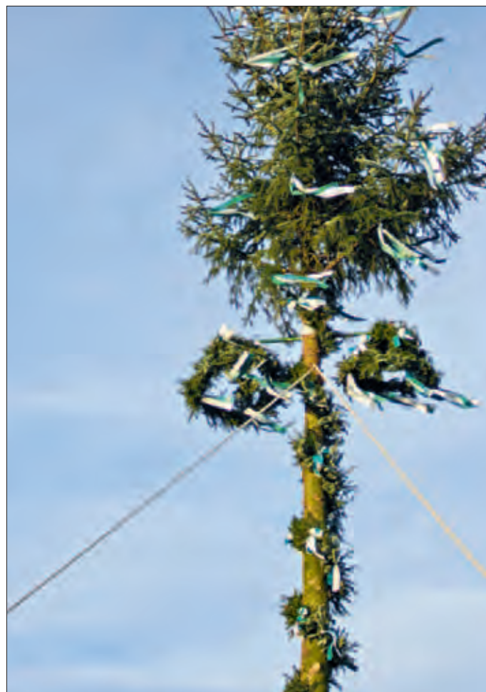
Da steht er in voller Pracht