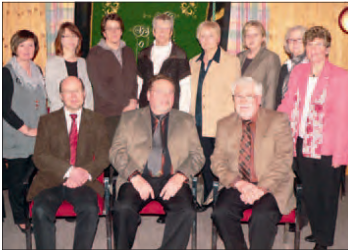
Der aktuelle Vorstand der Chorgemeinschaft.