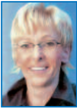
von Astrid Vockert, Vizepräsidentin des Niedersächsi- schen Landtags

Die Kinder sind und bleiben unsere Zukunft – deshalb liegt die Förderung der Kinder zu eigenverantwortlichen Persönlichkeiten auch in der Mitverantwortung der Politik. Ganz besondere Bedeutung im Rahmen dieses Ziels misst die CDU-Landtagsfraktion dabei der frühkindlichen Bildung und Betreuung zu: