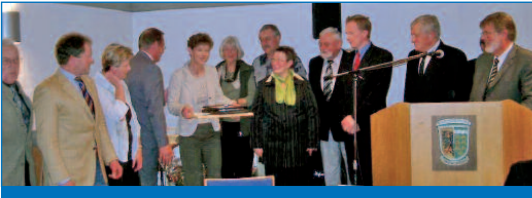
Ehrung: „Mitglieder des Samtgemeinderates“

(Auszug aus der Rede des Samtgemeindebürgermeisters Wolfgang Neumann am 30.10.06):